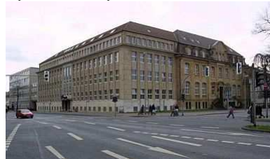
NRW.BANK Friedrichstraße 1 Münster