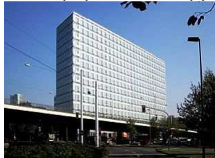
NRW.BANK Kavalleriestraße 22 Düsseldorf